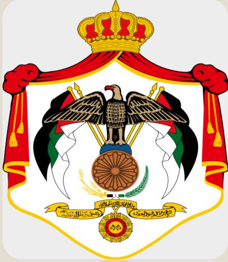
شعار المملكة الأردنية الهاشمية