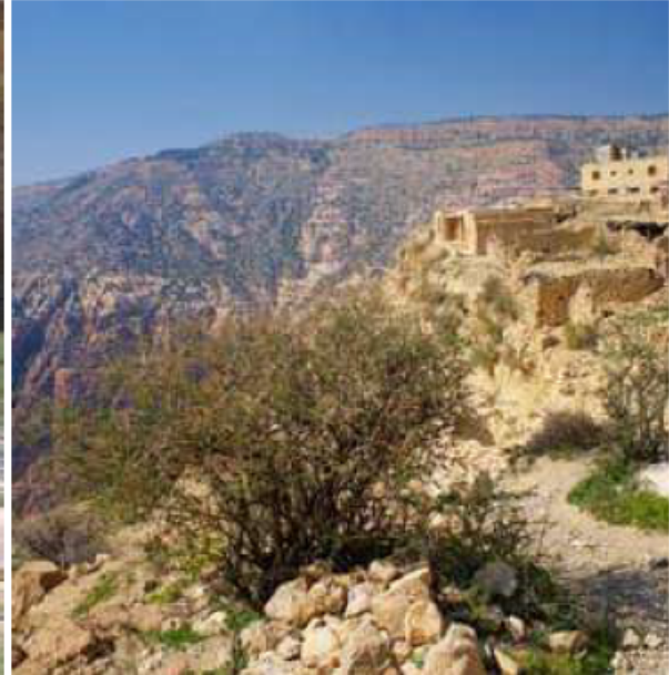
▲ محميّة ضانا.