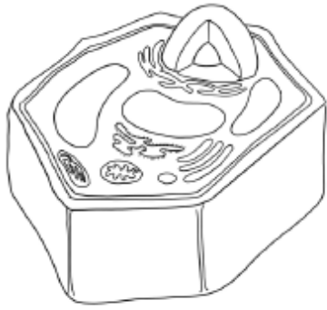
الخلية التي رسمتها منى