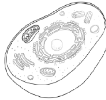
الخلية التي رسمها أحمد

لأن لها شكل محدد وتحتوي على بلاستيدات خضراء