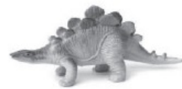
لا تمثل أحفورة

(5) أَثْنَاءَ رِحْلَةِ لَيْلَى وَشَقِيقِهَا أَحْمَدَ إِلَى إِحْدَى الْغَايَاتِ عَثَرَ عَلَى أَحْفُورَةٍ لِصَدَفِيَّةٍ، وَاحْتَلَفَا فِي تَفْسِيرِ وُجُودِ الْأَحْفُورَةِ؛ أَبَدَتْ لَيْلَى رَأْيَهَا فِي أَنَّ الْعَابَةَ كَانَتْ صَحْرَاءَ، بَيْنَمَا كَانَ رَأْيُ أَحْمَدَ أَنَّهَا كَانَتْ بُحَيْرَةً.