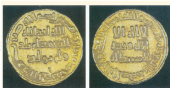
شكل (٣٠) نقود إسلامية قديمة