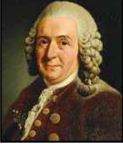
كارلوس لينيوس (1707 - 1778 م)

وضع أسس التصنيف العلمي الحديث، ونظام التسمية الثنائية للكائنات الحية.