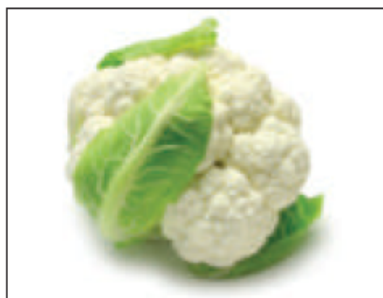
(ج) . القرنبيط . (الزهرة) ..