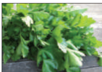
(هـ) ..... البقدونس .....