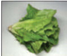
(ج) .. نيئة ..