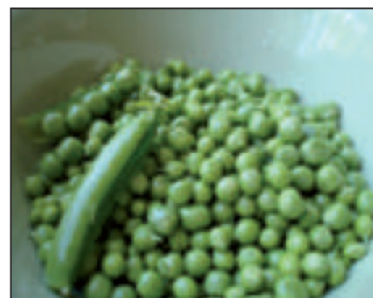
(أ) ..... البازيلاء .....