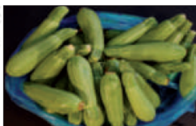
(و) ..... الكوسا .....