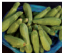
(هـ) .. مطبوخة ..