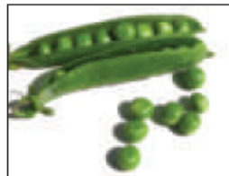
(ب) .. مطبوخة ..