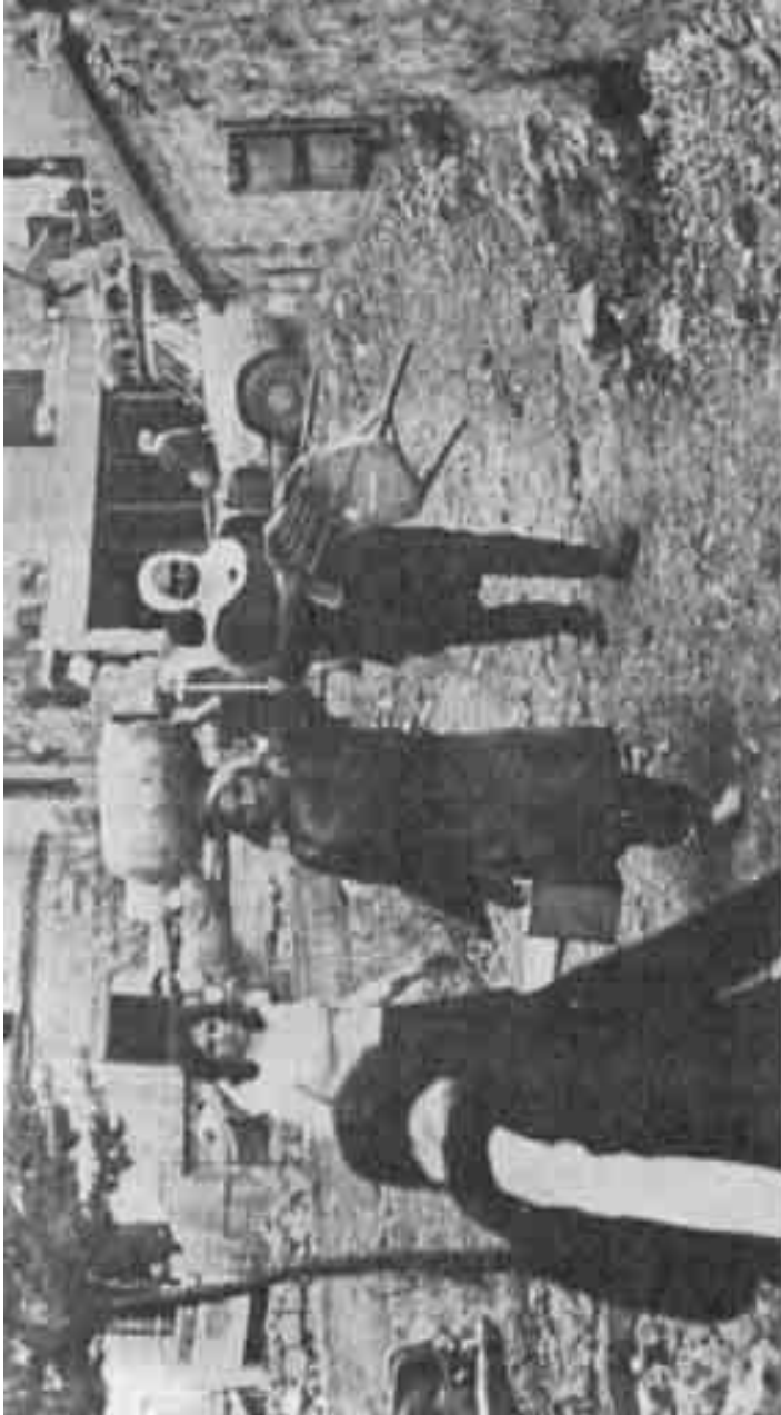
«السينما الفلسطينية» من فيلم «كفر شومون»