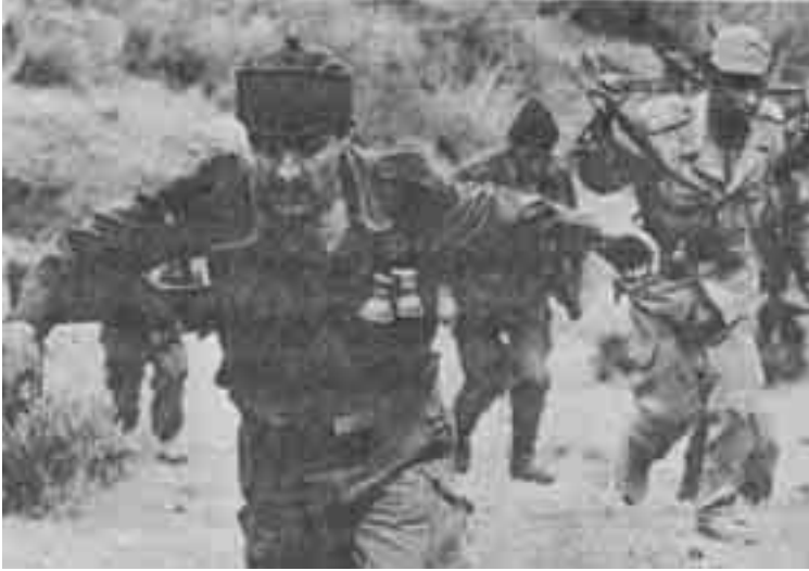
مشهد من فيلم «دورية نحو الشرق»-الجزائر