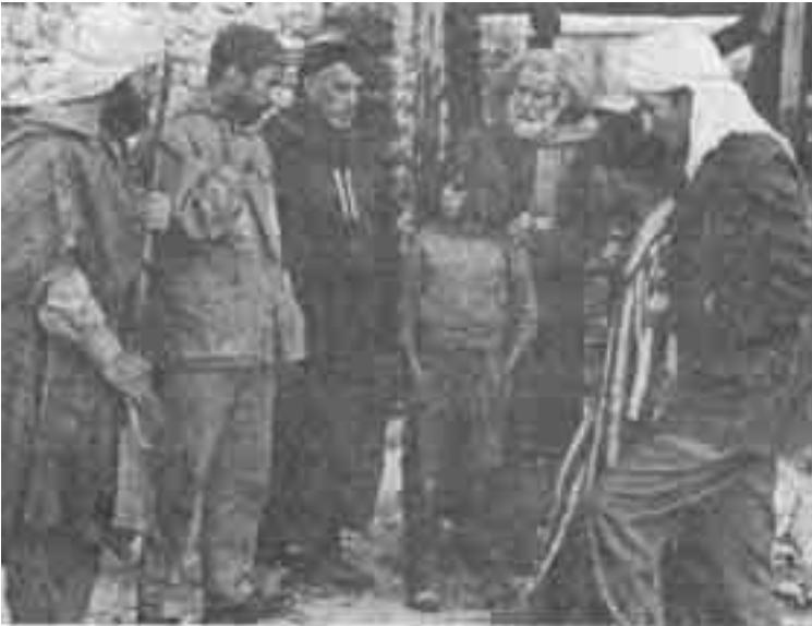
مشهد من فيلم «وقائع سنوات الجمر»-الجزائر