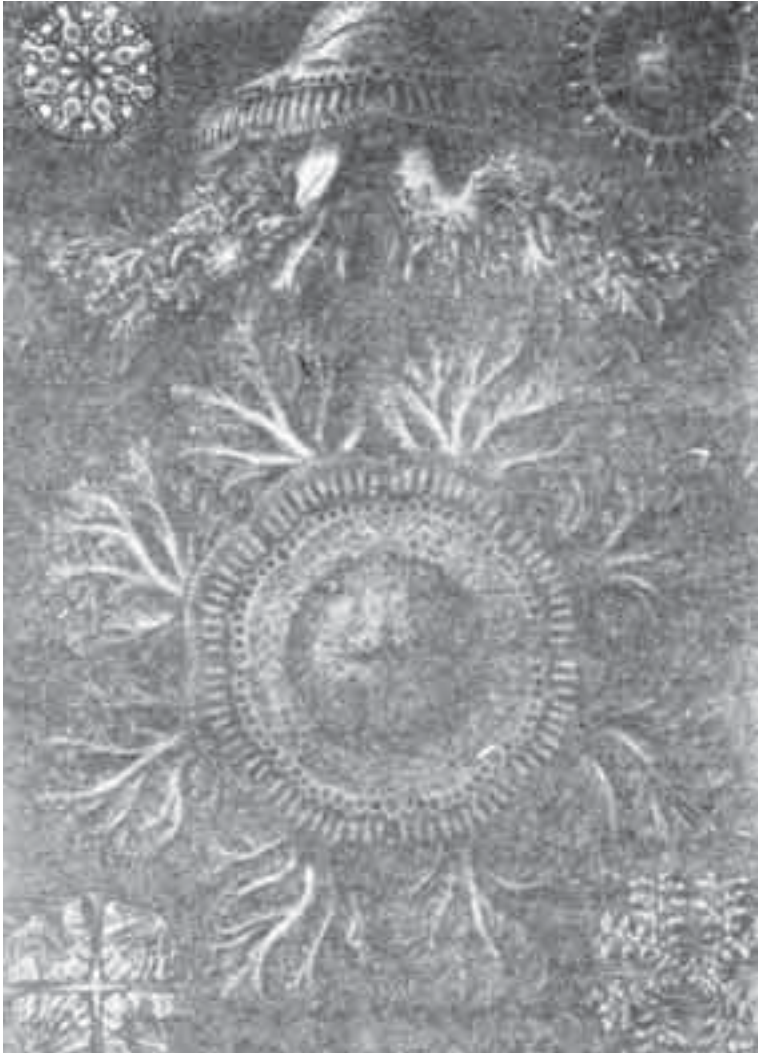
الشكل (4) - منظران فوقي وجانبي لقنديل البحر الأسطواني الشكل يُبيّنان تناسقا بدسعا في شكل مئمن أضلاع