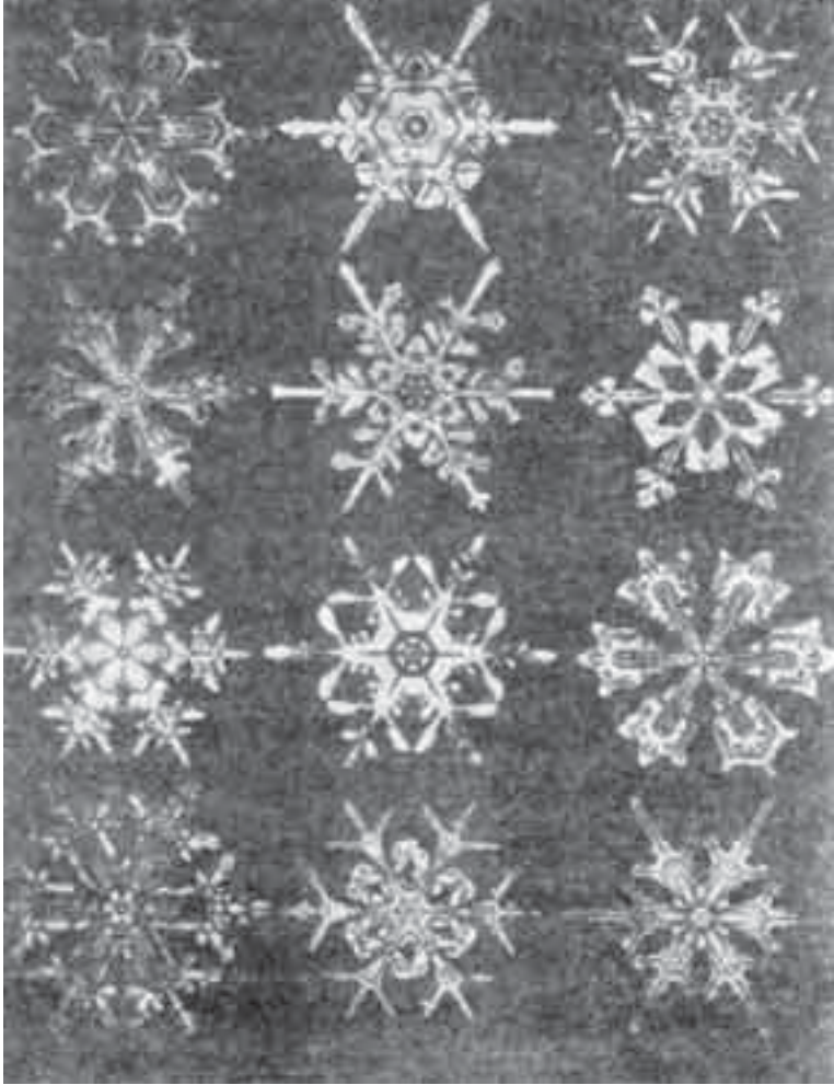
الشكل(3): ندف الثلج