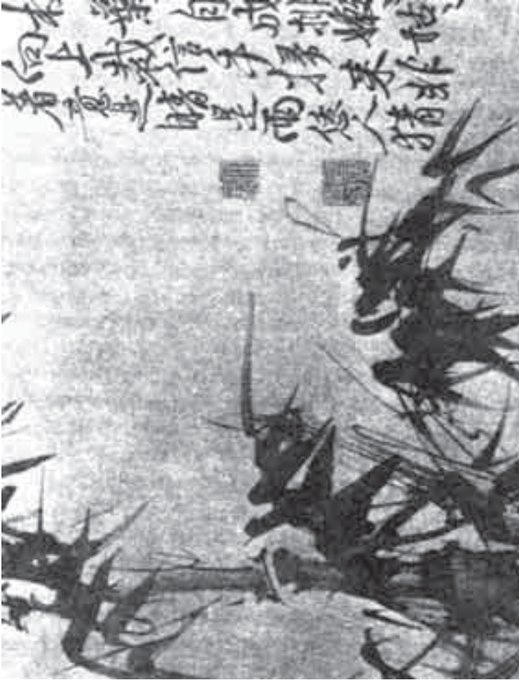
الشكل (5) - الرسام هو وين : الخيزران