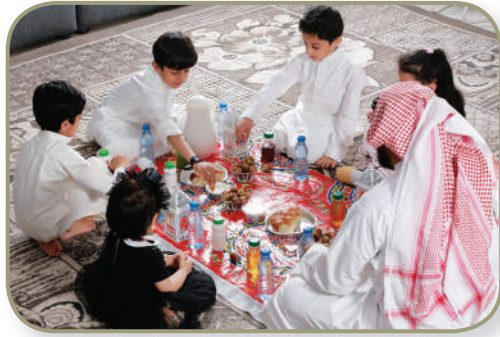
ماذا تعرف عن عبادة الصيام؟