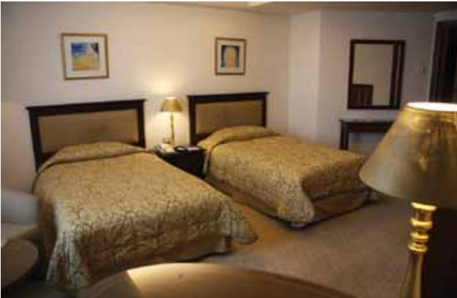
الشكل (١-٢): غرفة ذات سريرين مفردين.

هي غرفة مزودة بسرير مفرد واحد، مقاسه (٢٠٠سم X ١٠٠سم) تقريباً، كما في الشكل (١-١)، ويوجد فيها حمام خاص.