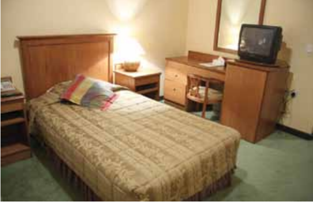
الشكل (١-١): غرفة مفردة.

لم يظهر في الصناعة الفندقية حتى الآن نظام تصنيف موحد للغرف، من حيث المساحات، والملحقات، والأثاث، والمعدات، ولكن اتفقت معظم المؤسسات الفندقية العالمية على أنواع الغرف الآتية: