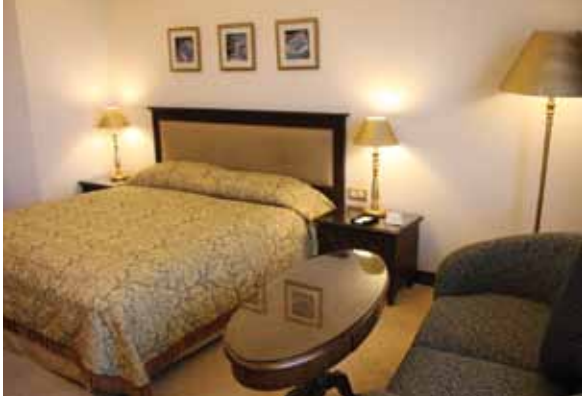
الشكل (٧-٢): الإضاءة في غرفة النوم.

ألوان الغرفة القاتمة ألواناً مضيئة، ويمكن تغيير لون الجدران باستعمال كشافات ملونة مخفاة فيها. ٥ . استعمال مظلّات النور المناسبة لألوان الأثاث ومحتويات الغرفة، مع مراعاة ألا تكون ألوانها قاتمة، وتُفضّل الإضاءة باستعمال (الفلوريسنت)، أو المصابيح البيضاء على المصابيح الشفافة.