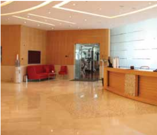
الشكل (٢): أرضية رخام في أحد الفنادق