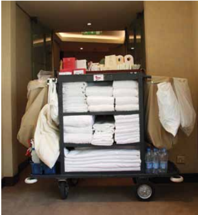
الشكل (٢): ترتيب المواد والأدوات على الرفوف.

– كيس للقمامة داخل كيس الكتان لحمايته من الأوساخ. – مكنسة يدوية أو فراشٍ للتنظيف.