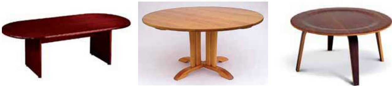
الشكل (٢-٤): أنواع الطاولات المستخدمة في غرف الفنادق وأشكالها.

ز - الطاولات (Tables): تصمم الطاولات بهيئات وارتفاعات مختلفة، بحيث تناسب الغرض المطلوب منها، فهناك الطاولات الخاصة بالغرف، منها: الدائري والبيضوي والمستطيل والمربع. وهناك طاولات خاصة بالشرفات، انظر الشكل (٢-٤) الذي يمثل بعض أنواع الطاولات المستخدمة في غرف الفنادق وأشكالها.