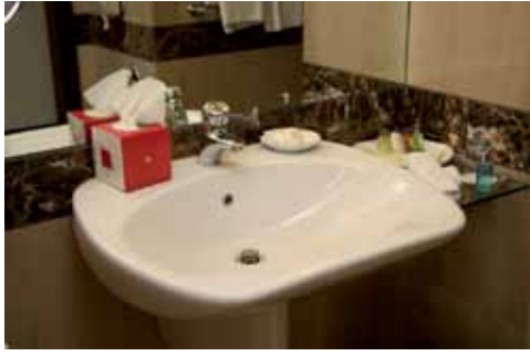
الشكل (١): مغسلة في أحد الفنادق.