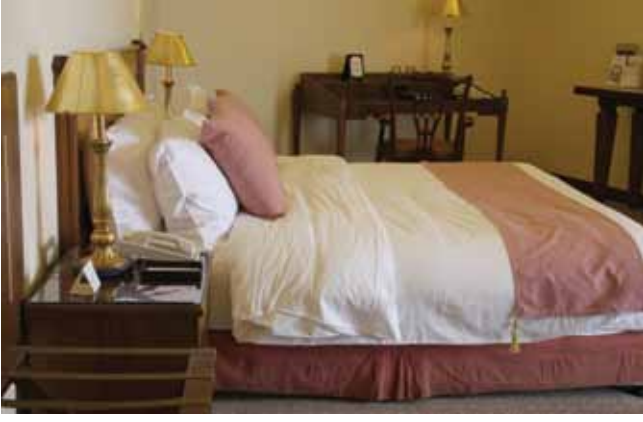
الشكل ( ١ - ٩ ): الوسائد.

بطانية واحدة فوق الشرف. ويجب تغيير غطاء اللحاف على نحو دوري أوعند الزوم، وفي بعض الفنادق، يستعمل غطاء فوقيّ وغطاء لحاف، وهذا يتطلب غسلًا أقلّ.