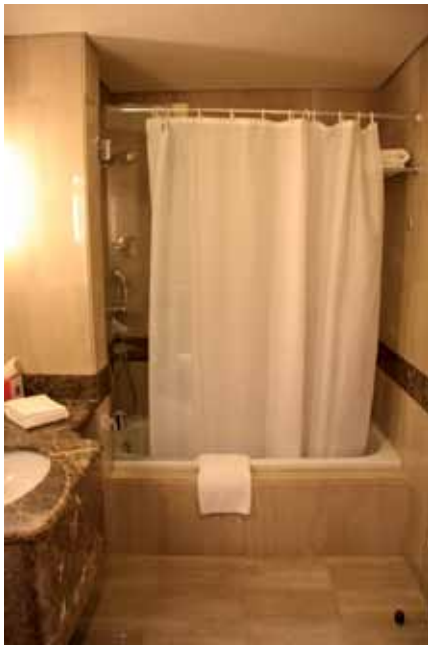
الشكل (٢-٦): ستارة الحمام.

ي - الستائر (Curtain): تختلف الستائر من فندق إلى آخر حسب درجة تصنيفه، وتستخدم لتغطية النوافذ المكشوفة، أو تعقيم الغرفة عند الضرورة، وتساعد على التقليل من تسرب الحرارة، وتخفيف الصوت، فضلًا عن الناحية الجمالية، إذ توحى بالراحة والاتساع والهدوء والدفء، وخاصة إذا أحسن اختيارها، لتناسب الأثاث والسجاد. وهناك أشكال متعددة من الستائر، فقد تكون قماشية عادية، أو ذات شرائح رأسية، وهناك ستائر ذات قطعتين، تكون فيها القطع السميكة من نوع غطاء السرير نفسه منقوشة أو غير منقوشة، وفي الوسط يوضع قماش شفاف يطلق عليه اسم (الشفيفون)، الذي يوحى بالاتساع والضوء الساطع، ويستخدم في غرف النوم والصالات الكبيرة. وهناك ستائر توضع بعرض الشباك فقط، وستائر أخرى تغطي الحائط بأكمله، أما الستائر المعدنية فتغطي الشباك فقط، وهناك أيضًا ستارة الحمام التي تصنع من البلاستيك (اللدائن) السادة أو المنقوشة. انظر الشكل (٢-٦). ويجب أن تختار الستائر بعناية فائقة لا تقل عنها عند اختيار أقمشة التنجيد، أو دهان الجدران، أو ورق الحائط. لذا لا بد من مراعاة شكلها، ولونها، وأمور أخرى، أهمها: