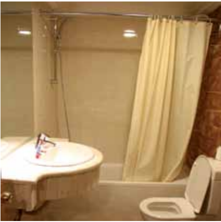
الشكل (١٤-١): حوض الاستحمام.

ج - تنظيف حوض الاستحمام: تمسح السطوح كلها من الداخل والخارج، وحول الحوض، بقطعة إسفنج، أو قماش، وبمادة تنظيف، ودع قليلاً من الماء يجري من الصنبور من دون إسراف ثم أزل الشعر، وأي شيء آخر عالق بسدادة الحوض؛ للتأكد من أن فتحة الحوض نظيفة، انظر الشكل (١٤-١).