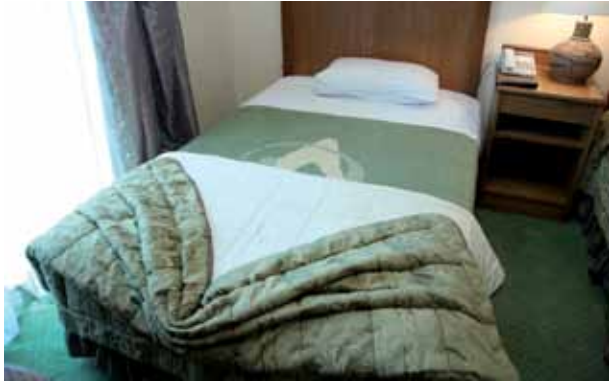
الشكل (١-١٨): سرير مرتب حسب الخدمة المسائية.