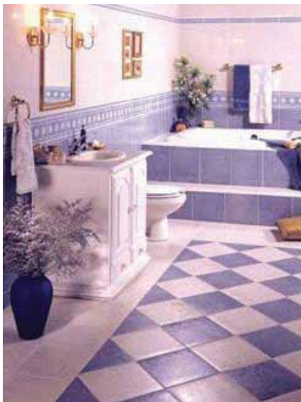
الشكل (٢-١٠): السيراميك.

تهتم الفنادق بجدران الغرف، وجدران القاعات العامة، من حيث التصميم والألوان؛ لما في ذلك من تأثير كبير في تناسق التزاويق (الديكورات)؛ ولإضفاء جو من الراحة و الاتساق مع محتويات المكان، وهناك العديد من المواد التي تغطى بها الجدران، مثل: