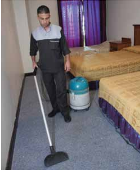
الشكل (١): العمل من غير انحناء.