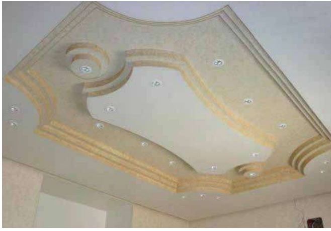
الشكل (٢-٨): سقف ألواح الجبس.

السقف، فضلاً عن ملاءمته العديد من أنواع (الديكورات) التي تستخدم في الغرف أو القاعات الأخرى، ومن أهم خصائصه أنه: