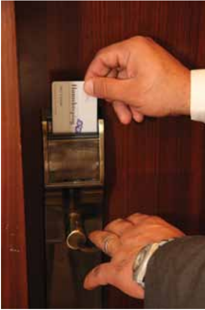
الشكل (٢): فتح الغرفة بواسطة البطاقة (الكارت).