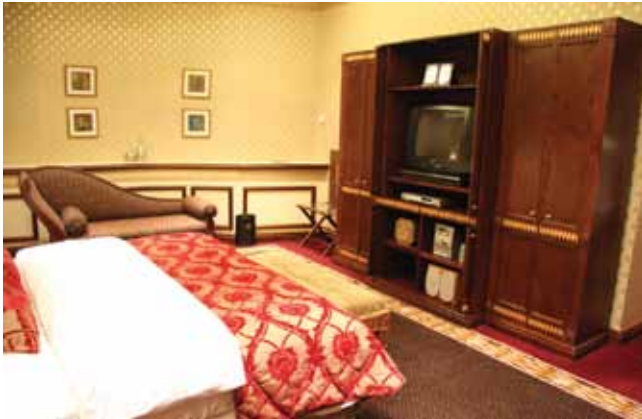
الشكل (١): غرفة نوم فندقية.

– اترك الباب مفتوحًا لحين تجهيز الغرفة. – أطفئ المكيف والتلفاز إذا كانا مشغولين. – تفقد بنظرة شاملة أنحاء الغرفة جميعها، كما في الشكل (١)، وبلغ مشرف التدبير الفندقية عن الآتي: