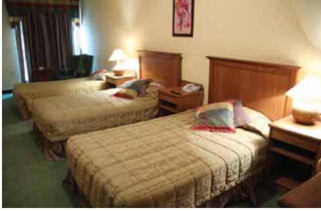
الشكل (١ - ٤): غرفة بثلاثة أسرة.