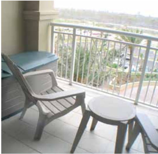
الشكل (١): شرفة في أحد الفنادق.