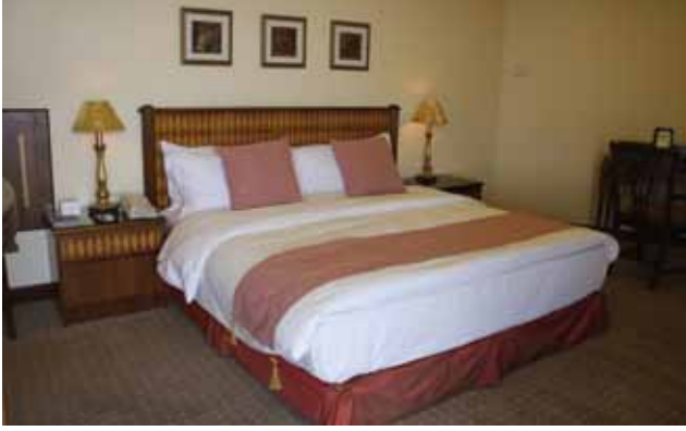
الشكل (٨-١): الستارة القصيرة.

ب - رأسية السرير: تستخدم الفنادق رأسيات أسرة مثبتة على الحائط، تصنع من الخشب الصلب أو الخشب المنجد، بحيث يتناسب قياسها مع الأسرة من الناحية الجمالية.