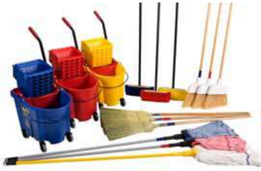
الشكل (٣-٥): أنواع المكناس والفراشي التي تستخدم في الفنادق.

ب - المكناس والفراشي (Brooms and brushes): هناك العديد من أنواع المكناس والفراشي