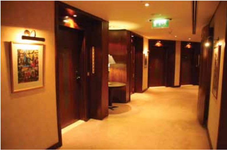
الشكل (١٧-١): ممر في أحد الفنادق.

(١٧-١) الذي يتضمّن ممرًا في أحد الفنادق.