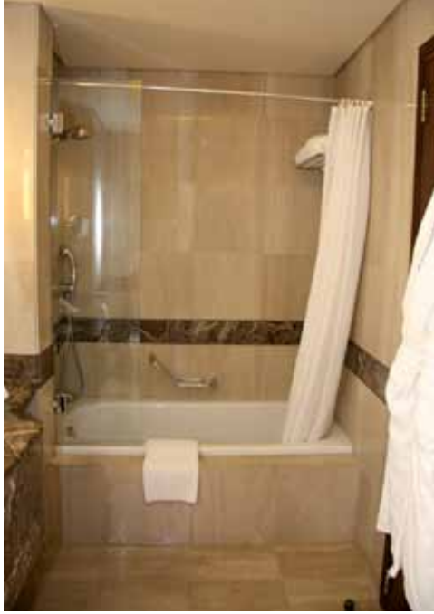
الشكل (٢): حوض الاستحمام في حمام أحد الفنادق.