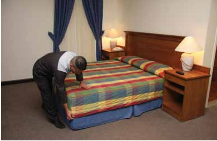
الشكل (١): ترتيب غطاء سرير الغرفة.

– افرش غطاء السرير (الحرام) بحيث يكون طرفه العلوي على بعد من طرف الشرشف الثاني العلوي بمقدار عرض وسادة السرير، أما باقي الأطراف فتكون مسدلة على نحو متوازٍ من الجوانب جميعها.