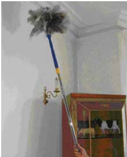
الشكل (١٦-٢): تنظيف السقف بالمنفضة.