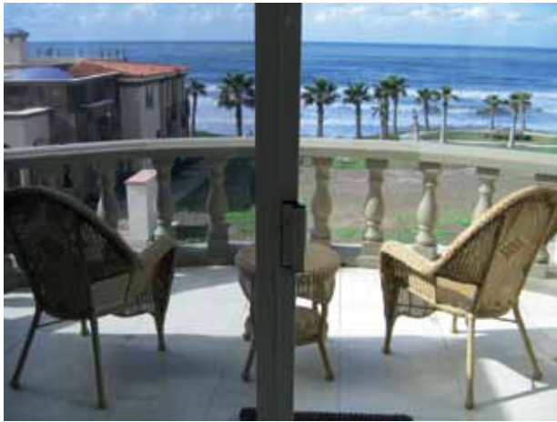
الشكل (١-١٦): شرفة في أحد الفنادق.

توجد في معظم الفنادق، وتكون مساحتها مناسبة، ليجلس الضيوف عليها بارتياح، وتكون مزودة بطاولة وعدد من الكراسي (عادة كراسيان في الغرفة المزدوجة)، انظر الشكل (١-١٦)، وتنظف الشرفة بدءًا بالطاولة والكراسي حسب المادة المصنوعة منها، فإذا كانت مصنوعة من البلاستيك تنظف بواسطة إسفنجة مبللة بالماء، وسائل تنظيف مناسب، ثم تشطف بالماء،