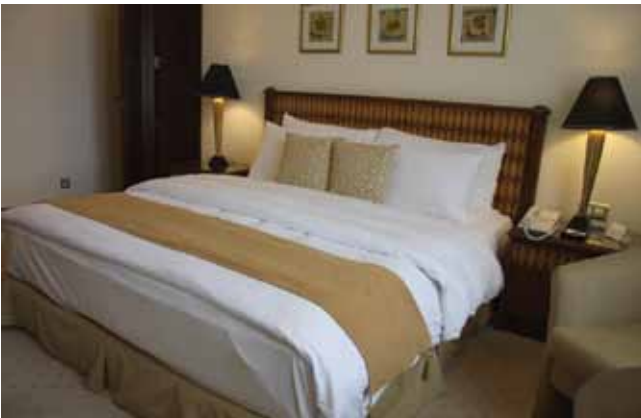
الشكل (١-٣): غرفة مزدوجة ذات سرير مزدوج.

هي غرفة مزودة بسريرين مفردين، مقاس كل منهما (٢٠٠سم X ١٠٠سم) تقريباً، كما في الشكل (١-٢)، إلا أن مساحة الغرفة أكبر من مساحة الغرفة المفردة، ويوجد فيها حمام خاص.