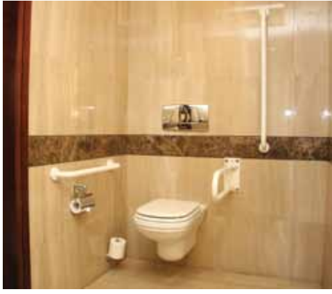
الشكل (٣): مرحاض في حمام أحد الفنادق.