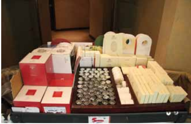
الشكل (١): ترتيب المواد والأدوات على الرف العلوي.

– نشرات الفندق وإعلاناته، وأوراق الرسائل، والظروف، وأوراق الفاكس، والأقلام ... إلخ. – لوازم الحمام، مثل: الصابون و(شامبو) للجسم، ومعجون مطرّ (توضع هذه المواد في علب صغيرة محكمة الإغلاق).