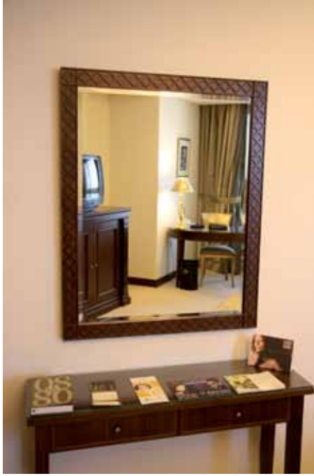
الشكل (٢-٥): طاولة التسريحة.

ودرج يوضعان خصيصاً؛ لتمكين المستخدم من وضع بعض أغراضه الشخصية انظر الشكل (٢-٥). ط - السجاد (Carpets): يستخدم السجاد في الفنادق لتغطية أراضي الممرات، وغرف النوم، أو أماكن العمل، أو قاعات الاجتماعات؛ لأن ألوانه، وزخارفه، وروعة تصميمه تضيف على المكان جمالاً ورونقاً، فهو يمتص الصوت، ويعطي الراحة والأمان في أثناء السير عليه، ويوفر الدفء في الجو البارد. إن قطع السجاد تتفاوت في قيمتها، من حيث حجمها، وجودة الصناعة، فكلما زاد عدد الخيوط في السنتيمتر المربع ارتفعت قيمة السجادة من الناحية المادية، وقيمة الأرضية من الناحية الفنية، وهناك ميزات أخرى تعطي للسجاد قيمة أكثر، منها: