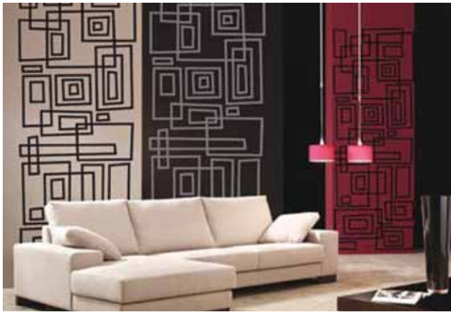
الشكل (٢-٩): ورق الجدران.