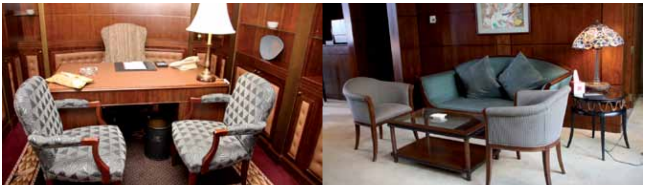
الشكل (٢-٢): أثاث منجد في أحد الفنادق.

هـ - الأثاث المنجد (Upholstered Furniture): يكثر استخدام الأثاث المنجد في الفنادق، مثل الكراسي المنجدة ذات المساند، أو من دونها، والتي توضع في غرف النوم، كما في الشكل (٢-٢)، ولذلك تحرص الفنادق على اختيار أفضلها من حيث جودة الصنع وجمال الشكل، وتختار الحشوات الزنبركية المشدودة جيداً، أو الحشوات الصناعية الحديثة (البوليستر) التي تتصف بالمتانة والمرونة والرقية. أما أقمشة التنجيد فيفضل أن تكون من قماش الحرير، وذات نقوش وزخارف، وألوان جذابة توحى بالرقية والفخامة. وكثير من الفنادق تستخدم أقمشة التنجيد المصنوعة من الصوف، أو الأقمشة الصناعية القوية المتينة، ذات النقوش والألوان والزخارف الجميلة.