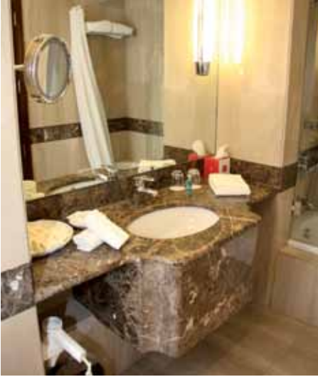
الشكل (١٣-١): المغسلة.

مناسبة، وينظف بها حوض المغسلة من الخارج والداخل، وصبور الماء، وأنابيب الصرف الصحي، والقاعدة، وحواف حوض المغسلة، والسدادة، والسلسلة، ثم يُلمّع صببور الماء، وتمسح أيّ بقع أخرى عن السطوح بقطعة قماش جافة، انظر الشكل (١٣-١).