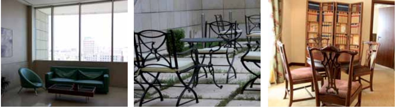
الشكل (٢-٣): أنواع المقاعد والكراسي المستخدمة في الفنادق.

و - المقاعد والكراسي (Seats and Chairs): تتوافر أشكال وحجوم مختلفة منها، ويجب أن تكون متينة ومريحة، قياساتها تناسب مستخدميها، وأن تكون متناسقة مع أثاث الغرفة أو الصالة، ويبين الشكل (٢-٣) بعض المقاعد والكراسي المستخدمة في الفنادق.