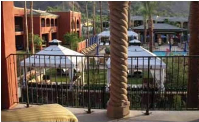
الشكل (٢-١٣): حديد الحماية في الشرفات.

انظر الشكل (٢-١٣). ويجب العناية به في أثناء التنظيف، وتجفيفه جيّدًا حتى لا يصدأ، ولا بدّ من إعادة طلائه بين مدة وأخرى، وكلما احتاج إلى ذلك.