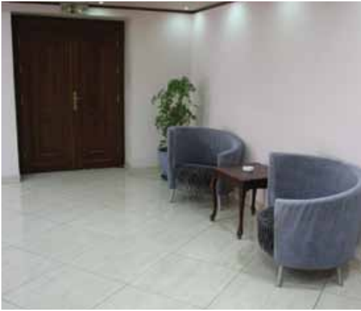
الشكل (١): أرضية سيراميك في أحد الفنادق

هناك العديد من أنواع الأرضيات الصلبة المستخدمة في الفنادق، منها الأرضيات الحجرية و(الموازايكو) و(السيراميك) والرخام. وللمحافظة عليها، تنظف باستمرار، باستخدام الآلات والمعدات، والمواد المناسبة.