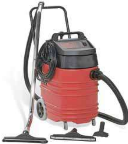
الشكل (٣-٣): المكنسة ذات الخرطوم.

تستخدم الفنادق العديد من الماكينات الكهربائية التي تحتاج إلى أيدٍ عاملة مدربة، ومؤهلة، لاستخدامها، ومنها: