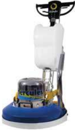
الشكل (٣-٢): ماكينة صقل الأرضيات وتلميعها.

تستخدم عند صقل الأرضيات مواد تتكون في الغالب من زيوت خاصة، ومواد مذيبة، تسهم في إغلاق المسامات الموجودة في أسطح الأرضيات، وذلك باستخدام ماكينة صقل الأرضيات، انظر الشكل (٣-٢)، ويساعد الخريص المعدني، وأحجار الصقل الخاصة على ذلك العمل، وتجرى عملية صقل الأرضيات وفق الآتي :