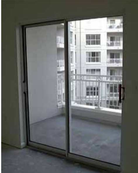
الشكل (١-١٥): باب زجاج.

زر أحد الفنادق، وتعرّف الأدوات والتجهيزات الموجودة في الحمام، التي صُمّمت عند الإنشاء، واللوازم التي وضعها مجهز الغرف، ثم اكتب تقريرًا عن ذلك، واعرض ما تتوصل إليه على زملائك في الصف.