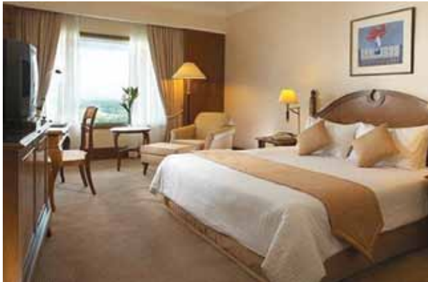
الشكل (١-٦): الجناح العادي.

يحتوي هذا النوع على أثاث يمتاز بالفخامة، ومساحته أكبر من الغرف العادية، فيه غرفة ملحقة مخصصة للجلوس داخل الجناح، عدد الأسرة فيها سرير واحد من نوع الأسرة المزدوجة، وفيها حمام كبير خاصّ بغرفة النوم، وآخر خاصّ بالغرفة الملحقة انظر الشكل (١-٦).