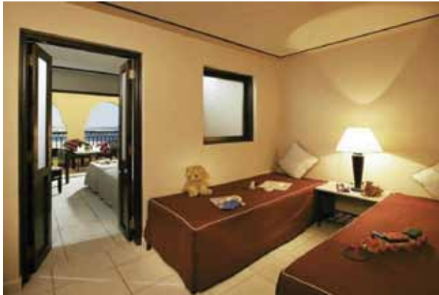
الشكل (١-٥): غرفة ستوديو.

يحتوي هذا النوع من الغرف على مقومات الغرف الفندقية جميعها من أثاث وتجهيزات، مساحتها أكبر نسبياً من الغرف العادية، وفيها مساحة مخصصة لمقاعد الجلوس، وعدد الأسرة فيها سرير واحد من نوع الأسرة المزدوجة، أو سريران من نوع الأسرة المفردة، ويوجد فيها حمام خاص كبير، كما في الشكل (١-٥).