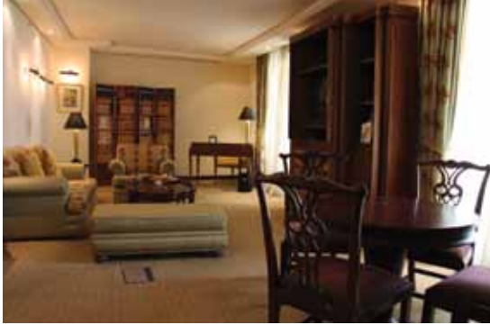
الشكل (٢-١٢): السطوح الخشبية.

واسع في تصنيع الأثاث، لانخفاض سعرها وسهولة الحصول عليها، وسهولة تشكيلها، وصلقلها، وهي متوافرة بمقاسات مختلفة وعديدة، ومن أمثلتها خشب السويد. أما لأخشاب الصلبة فيصنع منها الأثاث الفخم الذي يحتاج صنعه إلى مهارة عالية، وإلى أيدي ماهرة من أجل تشكيله، ويمتاز بارتفاع سعره، ومن أمثلتها: خشب الجوز، والبلوط.