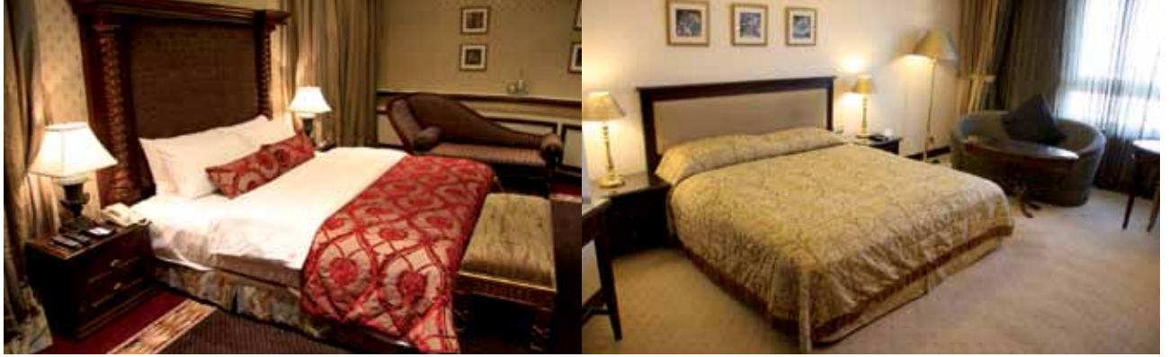
الشكل (٢-١): أنواع أغطية الأسرة المستخدمة في الفندق.

د - الخزائن (Cupboards): تستخدم الفنادق أنواعاً مختلفة من الخزائن، فقد تكون الخزانة منفصلة عن الجدار، أو مصممة ضمنه، وينبغي أن تكون ذات حجم مناسب، وتحتوي رفوفاً وأدرجاً متعددة، ويفضل أن يكون عمقها (٦٠ سم) تقريباً، مع احتوائها على عدد من علاقات الملابس، وبعض المستلزمات التي يمكن أن يحتاج إليها الضيف. وهناك نوع آخر من الخزائن الصغيرة (كوميدينا) (Bed Side Cupboard) توضع بجانب السرير غالباً، ليضع الضيف فيها حاجاته الشخصية.