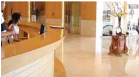
الشكل (١): أرضية رخامية في أحد مرافق الفندق.

– افصل التيار الكهربائي عن الماكينة، ونظفها، وثبت السلك الكهربائي في مكانه عليها، وأعدّها إلى مكانها في المستودع.