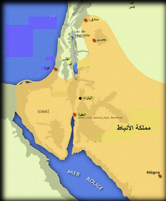
خريطة مملكة الأنباط