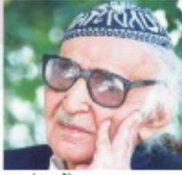
محمد مهدي الجواهري ( ١٨٩٩ - ١٩٩٧ )