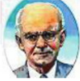
إيليا أبو ماضي