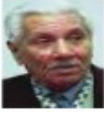
عبد الوهاب البياتي