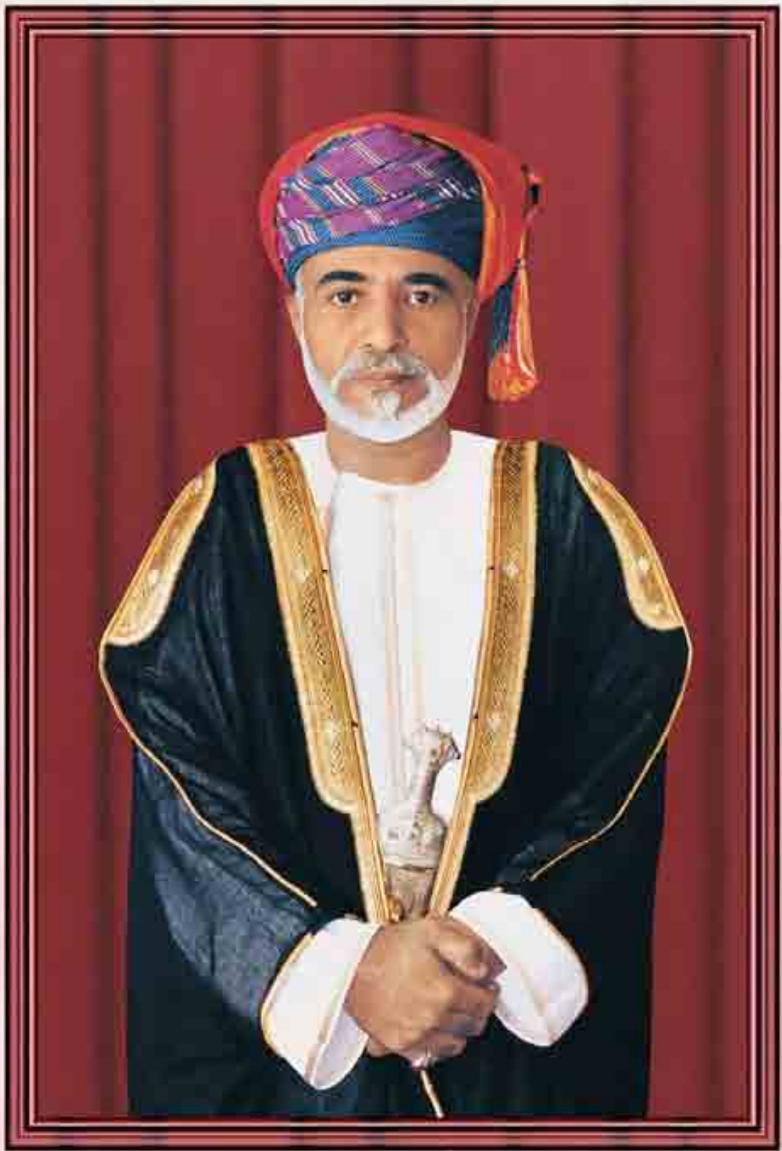
حضرة صاحب الجلالة السلطان قابوس بن سعيد المعظم