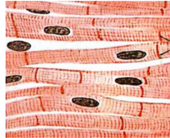
خلايا عضلية قلبية

تختلف الخلايا النباتية والحيوانية في الصور السابقة من حيث: الشكل، والحجم، والوظيفة التي تؤديها.