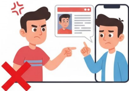
نشر خبر كاذب عن شخص (تنمر)