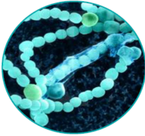
بكتيريا خضراء مُزرقَّة

• تأمل الصور الآتية لبعض خلايا البكتيريا كما تظهر تحت المجهر الإلكتروني.