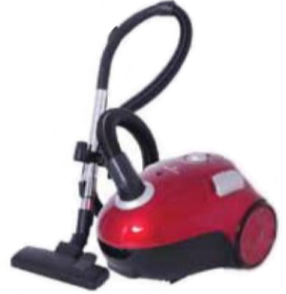
كنس السجاد بصورة آلية