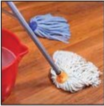
مسح الماء عن الأرضيات