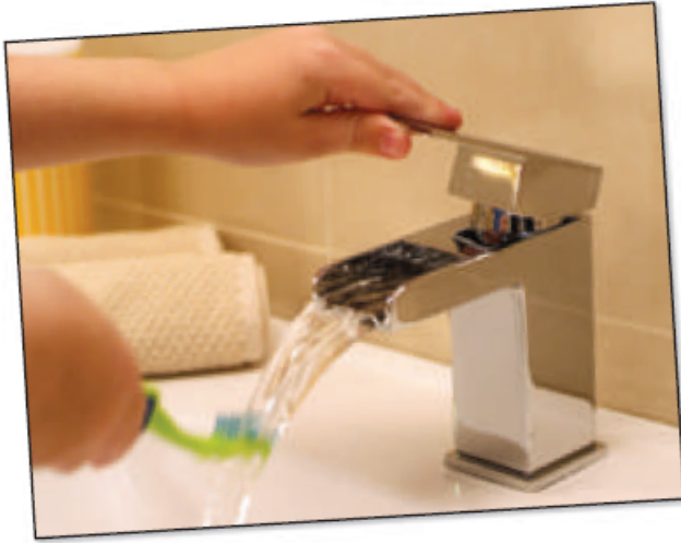
( د )