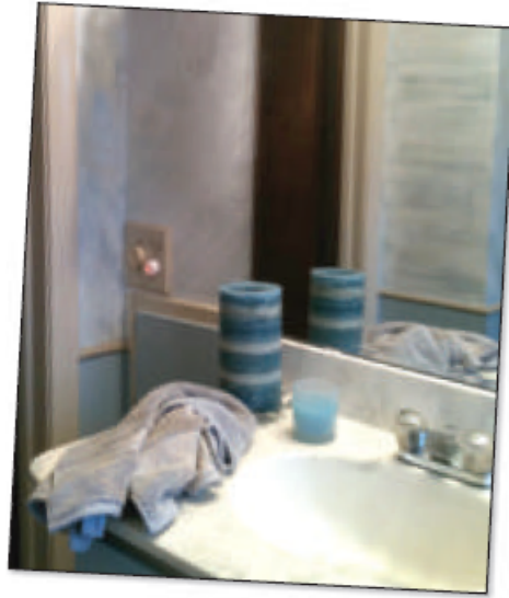
( ج )