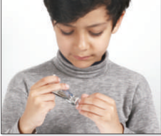
( ب )