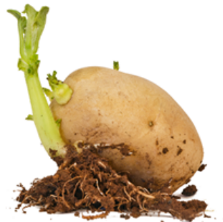
▲ نمو البرعم