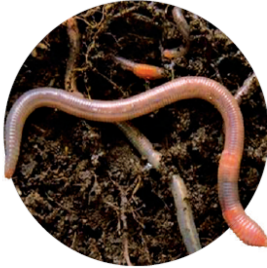
دودة الأرض من الديدان الحلقية.