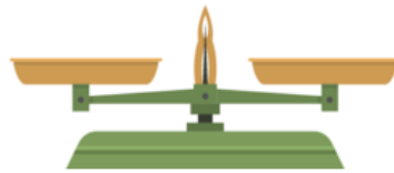
الميزان ذو الكفتين