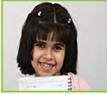
الفتاة مخلوق حيّ