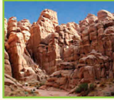
الحجر شيء غير حيّ