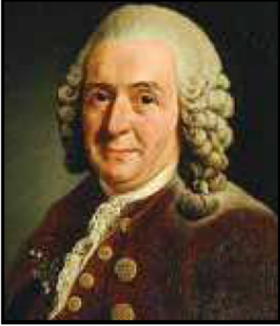
كارلوس لينيوس (1707 - 1778 م)

وضع أسس التصنيف العلمي الحديث، ونظام التسمية الثنائية للكائنات الحية.