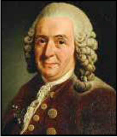
كارلوس لينيوس (1707 - 1778 م)

وضع أسس التصنيف العلمي الحديث، ونظام التسمية الثنائية للكائنات الحية.