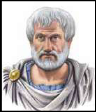
أرسطو (322 - 384 ق.م)