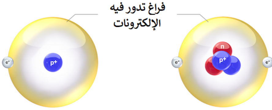
ذرة الهيدروجين minha.ji.net