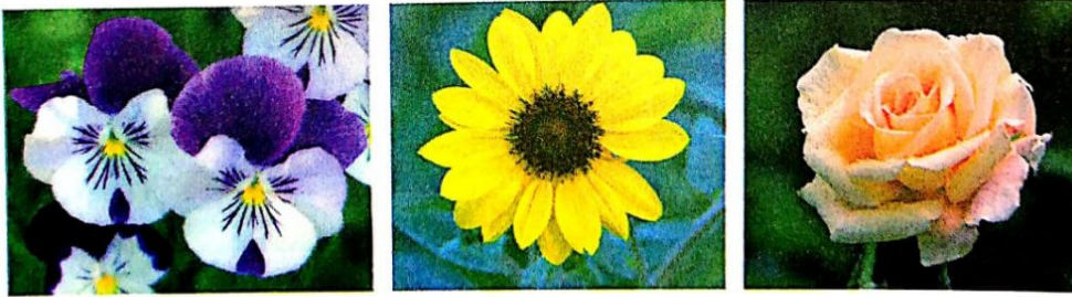
الشكل (٥-١/ج): أزهار مختلفة.

2. صنف الصفات الآتية للحيوانات إلى صفاتٍ وراثيةٍ وصفاتٍ مكتسبةٍ: