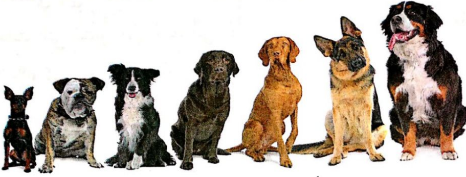
الشكل (٥-١/أ): مجموعة من الكلاب.